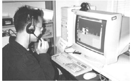
図3 実験設備（スタンフォード大学側）

ミーティングの開始前に、実験はコミュニケーション環境のテストが目的であり、何でも好きなことを話してください、と被験者に説明した。ミーティング中、部屋に被験者が1人である状態にした。すべてのミー-